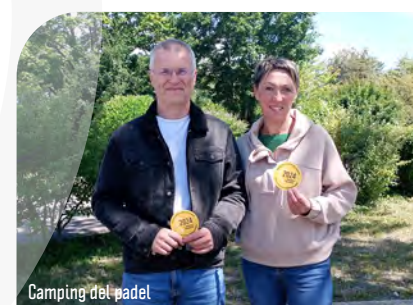
Camping del padel