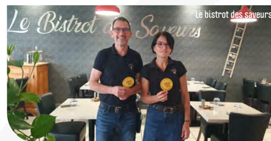
Le bistrot des saveurs