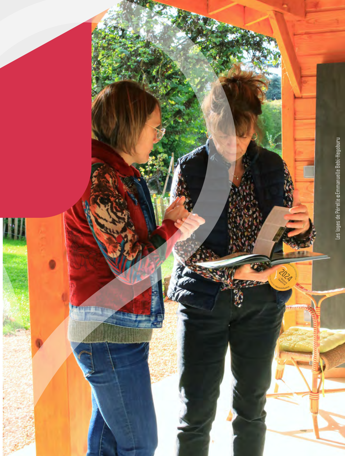
Les Loges de Pérelle

Cheffe du service développement touristique de la communauté de communes des Balcons du Dauphiné Directrice de l'Office de Tourisme