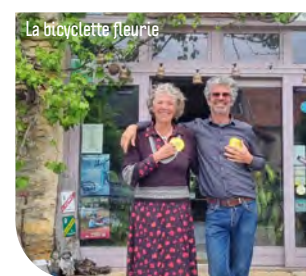
La bicyclette fleurie