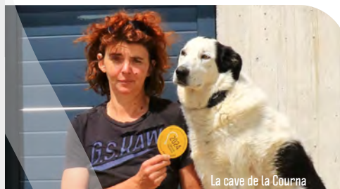
La cave de la Courna