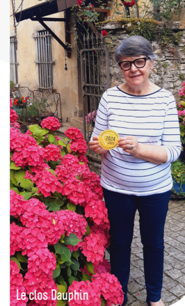
Le clos Dauphin