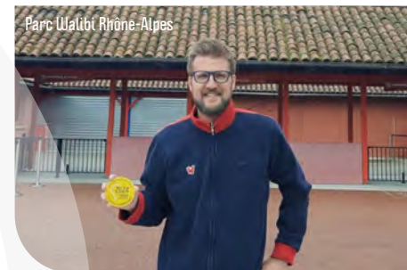
Parc Walibi Rhône-Alpes