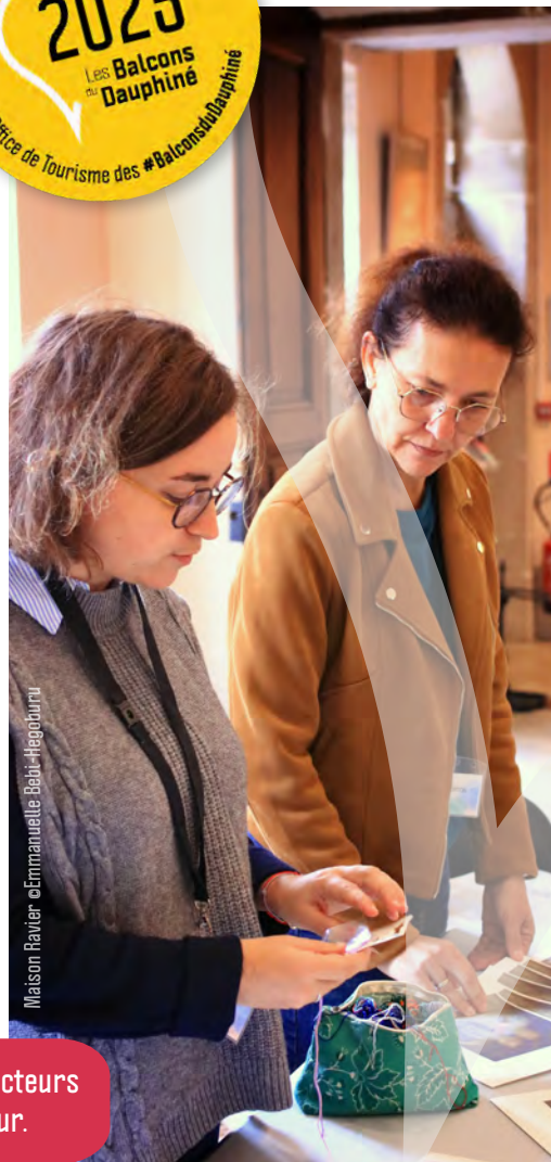
Maison Ravier

Nos actions de promotion-communication et de fédération des acteurs sont intégralement financées par les recettes de la taxe de séjour.