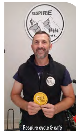
Respire cycle & café