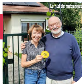
Le nid de mésanges