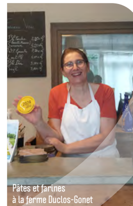
Pâtes et farines à la ferme Ductos-Gonet